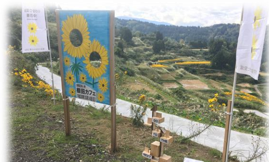
天空のお花畑 棚田カフェ